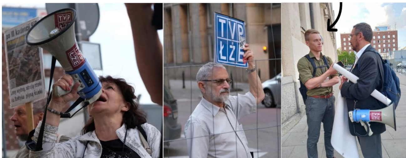
Birk Sebastian Kotkas

Foredraget sætter spot på presse- og mediefrihedens udvikling i Europa gennem personlige historier fra de folk, Birk Kotkas har mødt under sine reportagerejser samt hans arbejde med European Media Freedom Act i Europa-Parlamentet, der træder i kraft i 2025. Heriblandt en tyrkisk journalist, der blev fyret fra landets største avis efter 22 år, da Erdogan strammede grebet om magten – samt en gruppe polske demonstranter, der er gået på gaden 1.278 dage i træk, for at kæmpe for mediernes frihed.