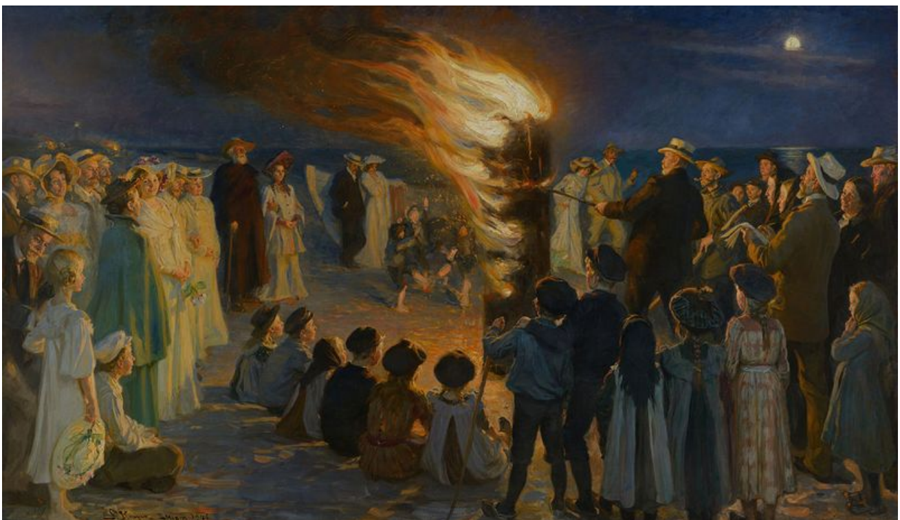
Sankt Hansblus på Skagen strand – P.S. Krøyer - 1906

Undervisningen foregår på Ingerslevs Boulevard 3, i Solsalen.