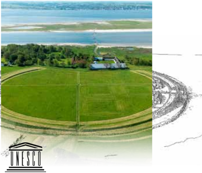
Danmarks største ringborg, Aggersborg