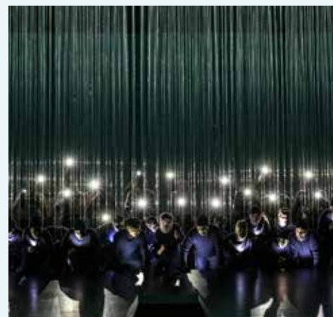
Der fliegende Holländer.

Ingerslevs Boulevard 3, 8000 Aarhus C, Solsalen.