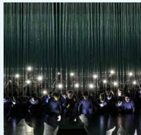
Der fliegende Holländer.

Ingerslevs Boulevard 3, 8000 Aarhus C, Solsalen.