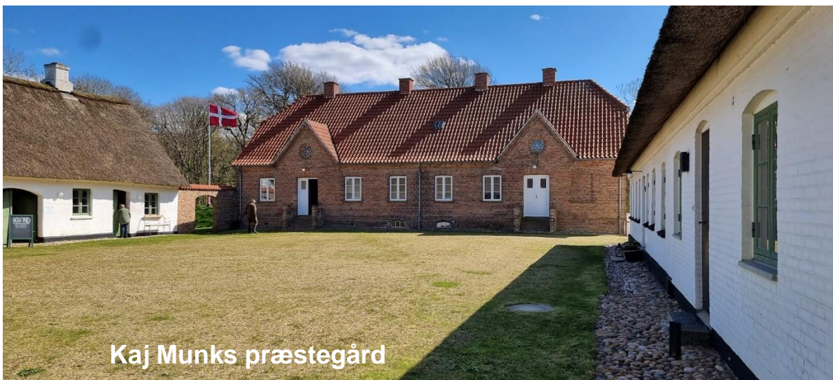
Kaj Munks præstegård