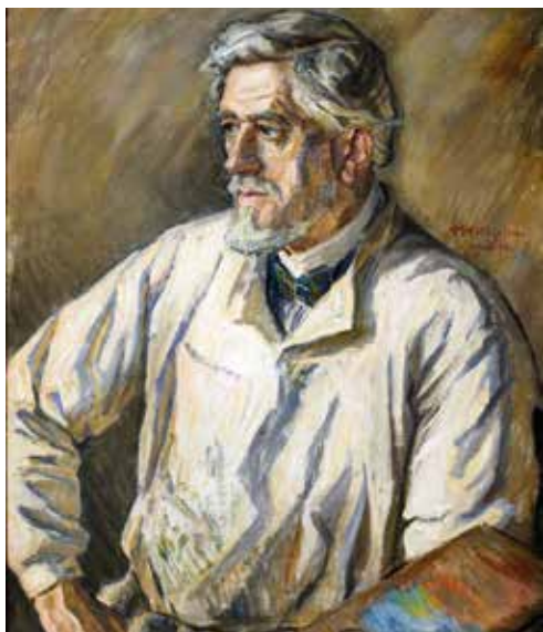
J.F. Willumsen, portræt