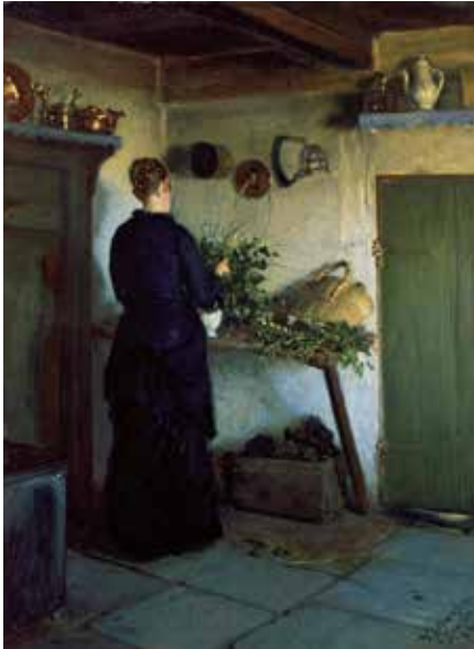
Viggo Johansen: Køkkeninteriør (1884)

På vejen introducerer vi til særudstillingen Hos mig – skagensmaleren Viggo Johansen , som vi skal se på Ribe Kunstmuseum, samt til Sct. Catharinæ Kirke og klostergård og til Ribe Domkirke.