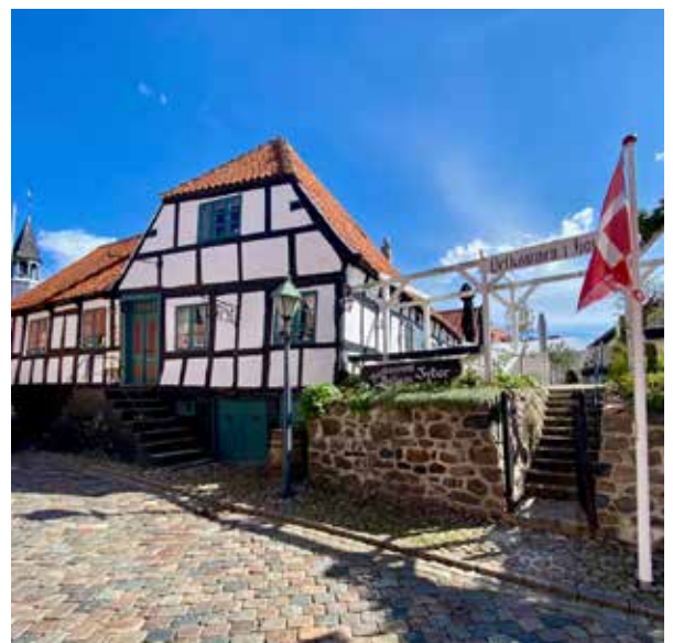
Restaurant Mellem Jyder, Ebeltoft

Kl. 16.00: Efter en dag fyldt med historie, kunst og smagsoplevelser vender vi hjem til Aarhus med forventet ankomst ved Musikhuset kl. 17.00 .