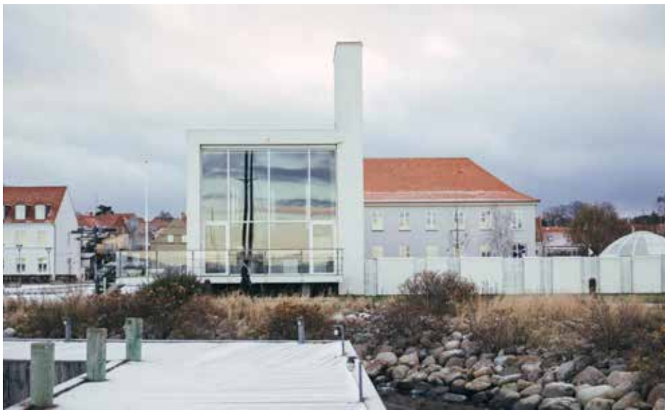
Museet Glas, Ebeltoft